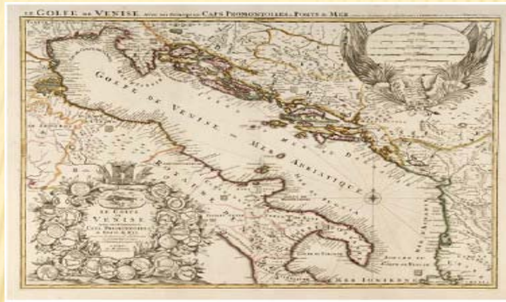
Carta geografica del secolo XVIII di P. Coronelli

La Via Lauretana è un'antica via di pellegrinaggio mariano che, fin dal Medioevo, ha collegato Roma al Santuario della Santa Casa di Loreto.