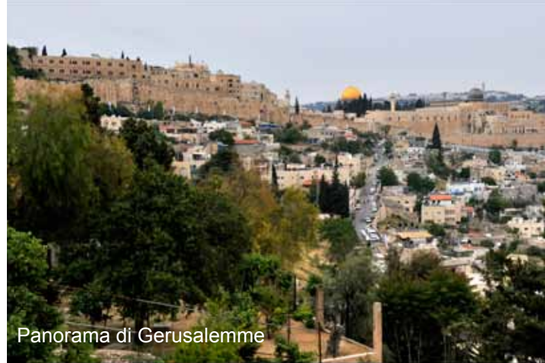
Panorama di Gerusalemme

Visita di Betlemme: il Campo dei Pastori, la Basilica della Natività. Nel pomeriggio: visita ad Ain Karem – visita panoramica della città. Rientro in hotel a Betlemme o Gerusalemme e pernottamento.