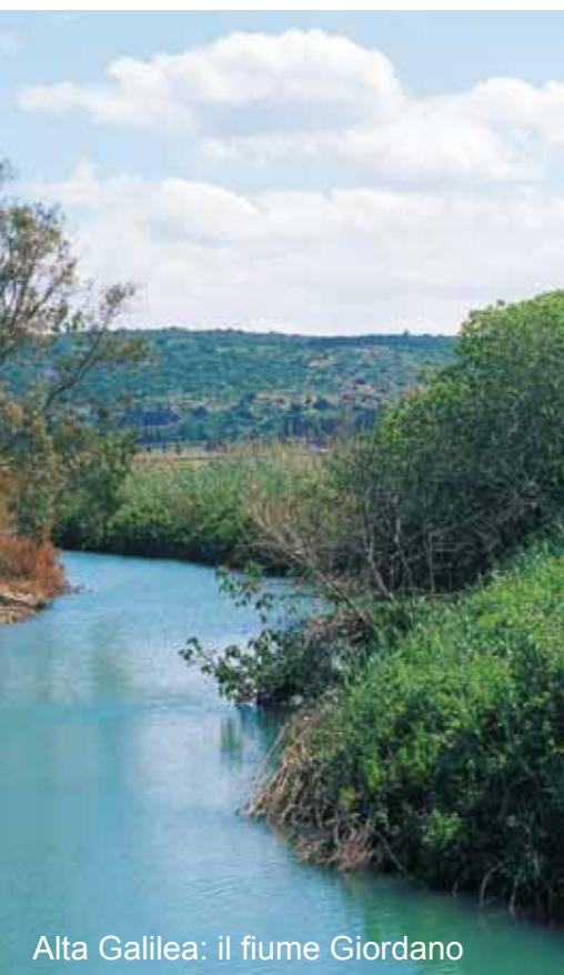
Alta Galilea: il fiume Giordano

Prima colazione. Tempo a disposizione, trasferimento in aeroporto per la partenza per l'Italia.