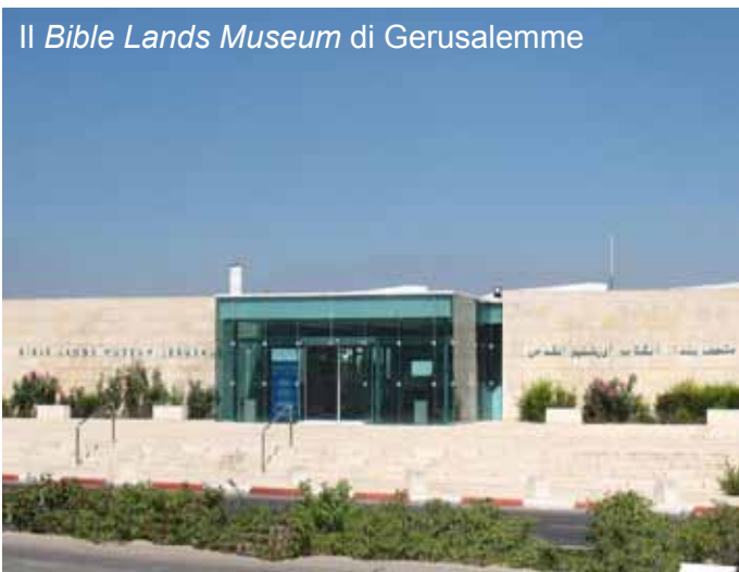
Il Bible Lands Museum di Gerusalemme

Nel pomeriggio, partenza per Tel Aviv e imbarco sul volo di ritorno per l'Italia.