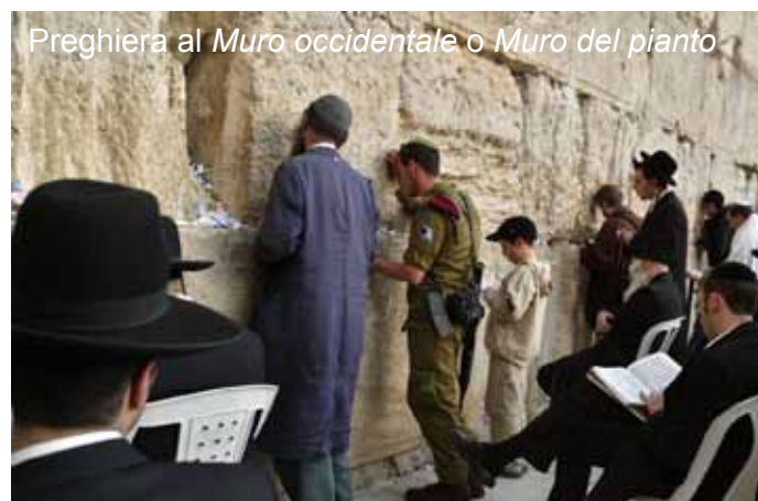
Preghiera al Muro occidentale o Muro del pianto

Nel pomeriggio, partenza per Tel Aviv e imbarco sul volo di ritorno per l'Italia.