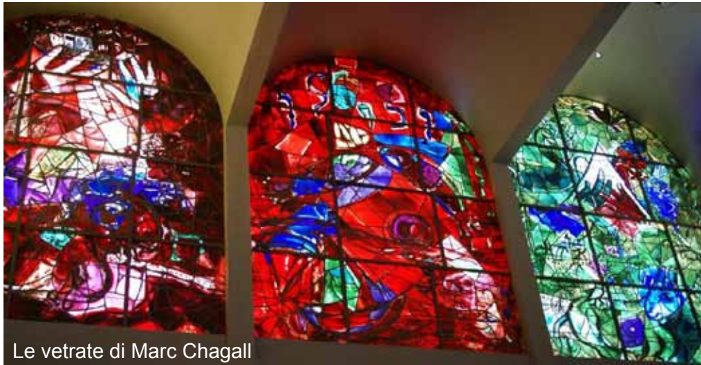
Le vetrate di Marc Chagall

emozionante e straziante al contempo. All'esterno, nel parco, visita alla " valle delle comunità perdute ", al " viale dei Giusti ", con oltre duemila alberi a ricordo e in onore dei Giusti tra le Nazioni che salvarono degli ebrei dallo sterminio nel corso della Seconda Guerra Mondiale. Nel pomeriggio visita al Monte degli Ulivi , antica area cimiteriale ebraica, ove si trova il Getsemani , località in cui Gesù, secondo i Vangeli, si sarebbe ritirato in preghiera prima della sua Passione.