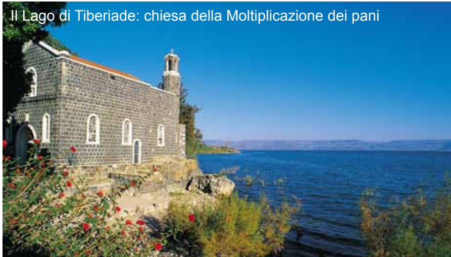
Il Lago di Tiberiade: chiesa della Moltiplicazione dei pani

Visita al Muro della Preghiera e, per chi lo desidera, messa la S. Sepolcro alle ore 06.00. Tempo per lo shopping nel suq della Città Vecchia. Partenza in tempo utile per l'aeroporto di Tel Aviv e imbarco per Milano/Roma.