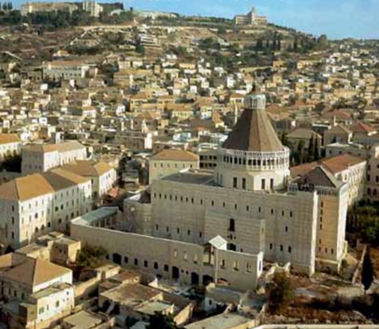
Nazareth: la Basilica dell’Annunciazione

Partenza per Tel Aviv. Rientro in Italia.