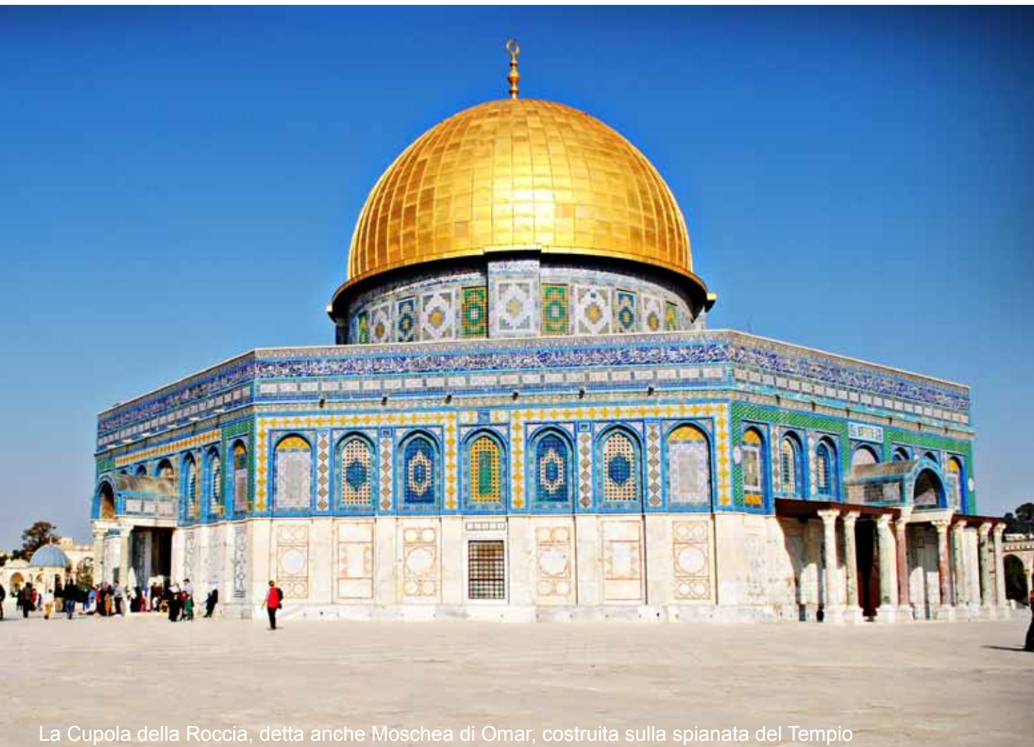
La Cupola della Roccia, detta anche Moschea di Omar, costruita sulla spianata del Tempio

Prima colazione. Trasferimento in aeroporto e partenza per l'Italia.