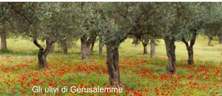
Gli ulivi di Gerusalemme

Prima colazione in hotel. Partenza per l'aeroporto e sosta a Ain Karem, luogo che ricorda l'incontro di Maria con Elisabetta e Zaccaria, genitori di Giovanni Battista (cf. Lc 1,39-56). S. Messa. Proseguimento per l'aeroporto in tempo utile per l'imbarco sul volo per l'Italia.