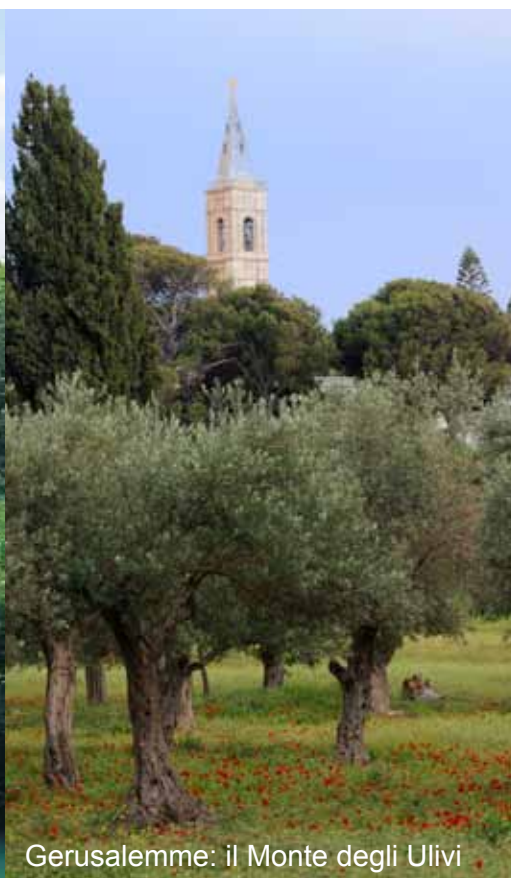
Gerusalemme: il Monte degli Ulivi