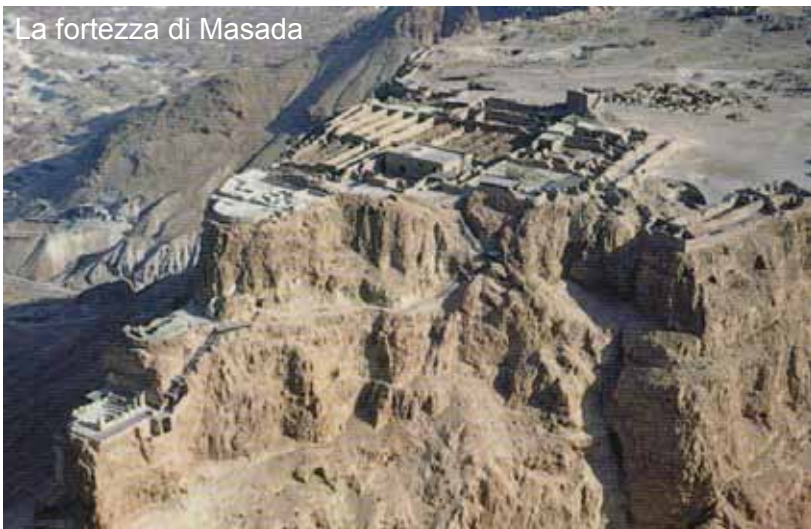
La fortezza di Masada

Partenza alla volta di Tel Aviv e imbarco per il rientro in Italia.