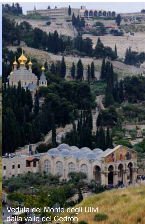
Veduta del Monte degli Ulivi dalla valle del Cedron