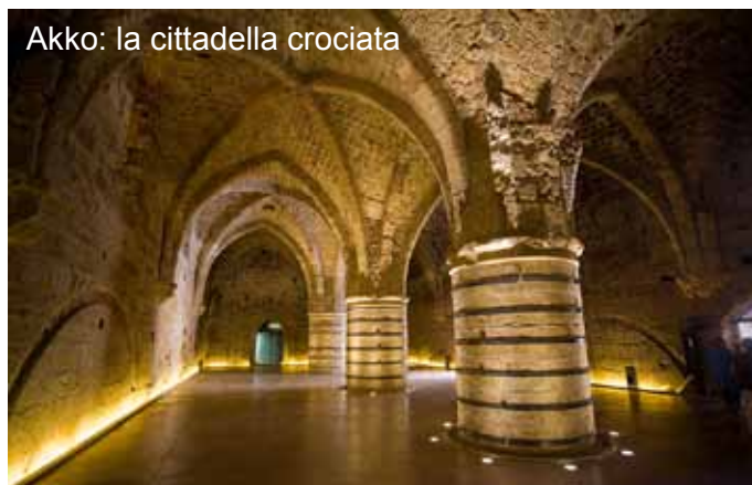
Akko: la cittadella crociata

Proseguimento per l'aeroporto di Tel Aviv; pratiche di imbarco e rientro in Italia.