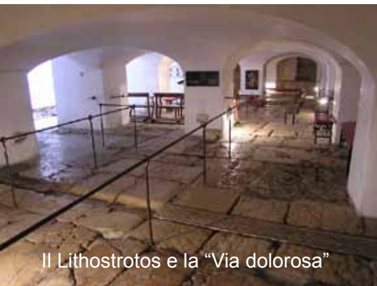
Il Lithostrotos e la "Via dolorosa"