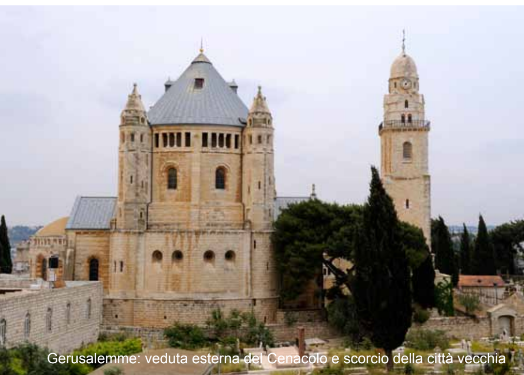
Gerusalemme: veduta esterna del Cenacolo e scorcio della città vecchia

Piccola colazione in hotel e trasferimento all'aeroporto di Tel Aviv e partenza per l'Italia.