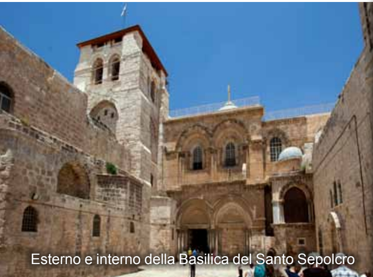
Esterno e interno della Basilica del Santo Sepolcro