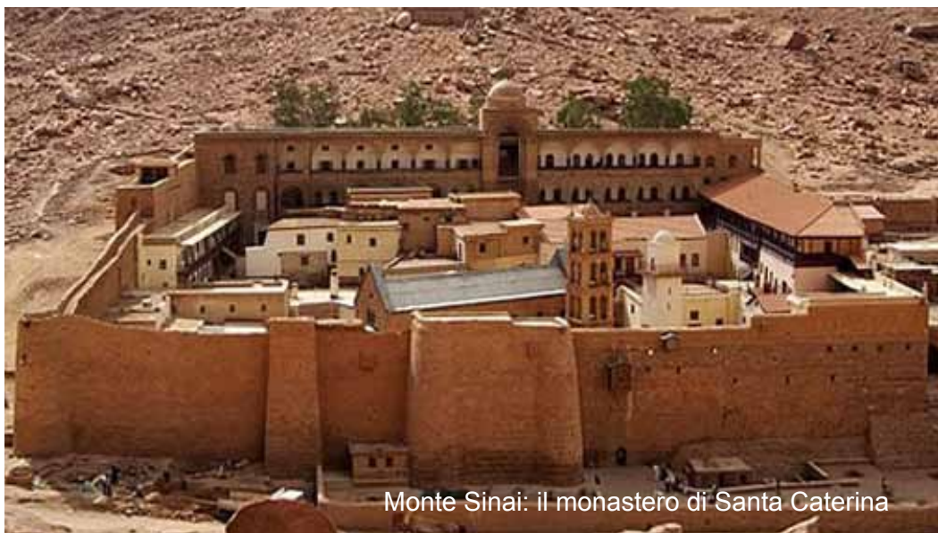
Monte Sinai: il monastero di Santa Caterina

Colazione in hotel e trasferimento all'aeroporto di Tel Aviv e partenza per l'Italia.