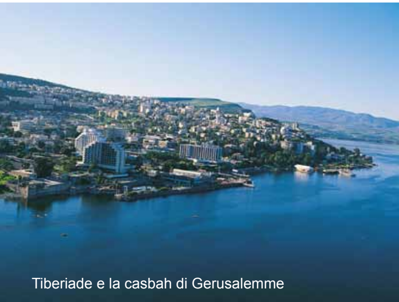
Tiberiade e la casbah di Gerusalemme

Colazione in hotel e trasferimento all'aeroporto di Tel Aviv e partenza per l'Italia.