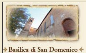
↳ Basilica di San Domenico ◀

"Masci" ( Scout adulti italiani ); luciano_pisoni@virgilio.it ; www.masci.it