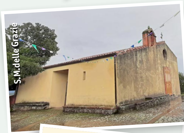
S. M. delle Grazie