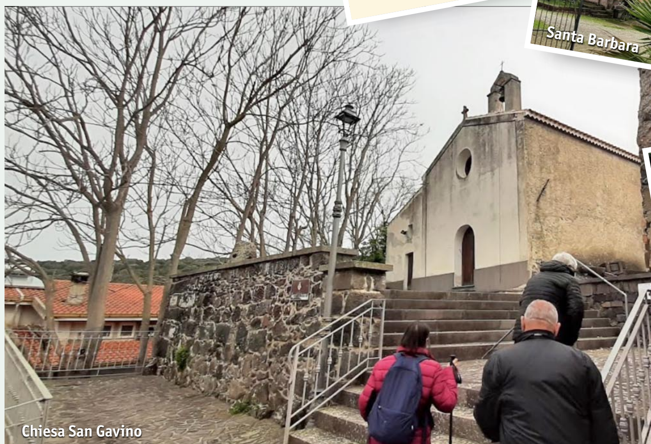
Chiesa San Gavino