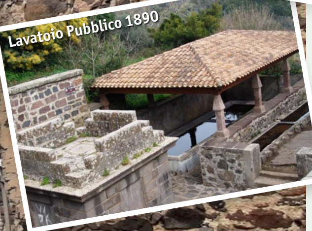
Lavatoio Pubblico 1890