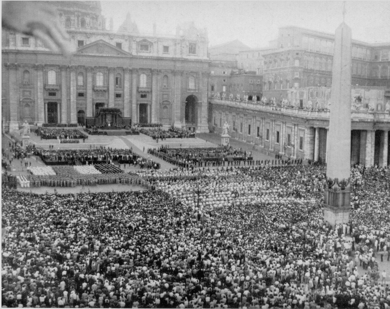
Una visione della Piazza S. Pietro durante l'udienza pontificia agli atleti partecipanti ai Giochi della XVII Olimpiade di Roma (24 agosto)