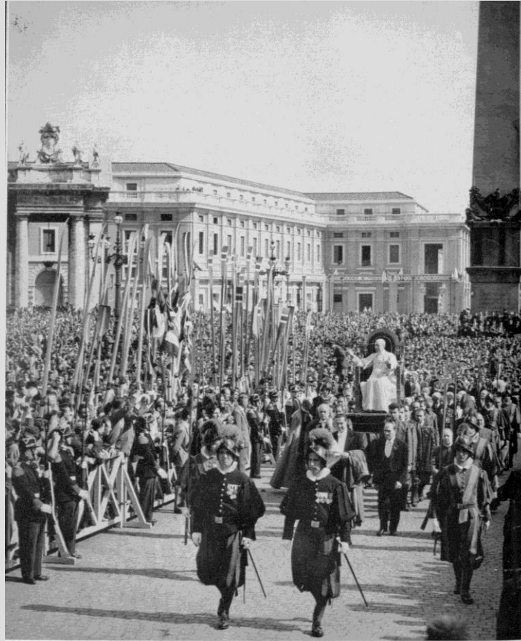
Il Santo Padre tra gli atleti del Centro Sportivo Italiano (9 ottobre)