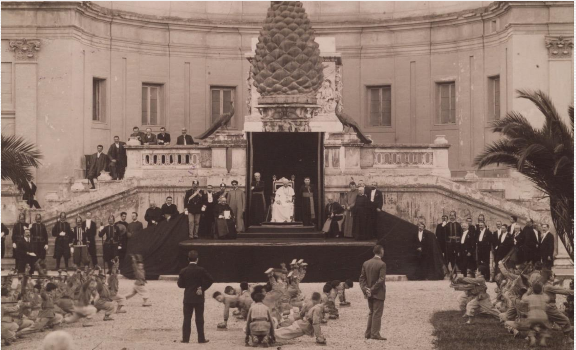
1904 – Saggio di un oratorio romano nel Cortile della Pigna